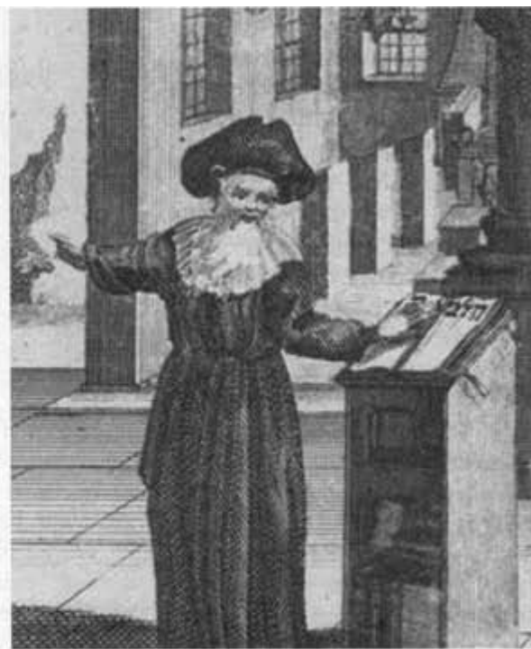
מימין ציור משנת תצ"ד: ראש הישיבה אומר שיעור. משמאל: הריסות בית הכנסת והישיבה בחורבן תרצ"ט

להפריש ממנה מעשר כספים. ברצותו לקיים מצווה זו, שהקפידו עליה ביותר בכל רחבי אשכנז, הציע לחברו הטוב ביותר שהיה במצב כלכלי לא טוב, שיחליפו את המעשר שלהם זה בזה. כך קיימו שניהם את המצווה, בלא לקפח את פרנסתם המוגבלת. מה היה מספר התלמידים בישיבה בתקופת השיא?